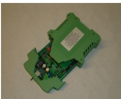
- Minimalspannungsrelais 0840.000