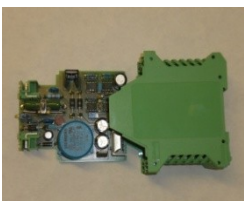
- Anlaufgerät für Batterieschutzschalter 0830.000

www.antome.de Email: kontakt@antome.de Tel .: 030/ 533 87 91 Fax .: 030/ 533 71 10 Pankstr. 8- 10 13127 Berlin