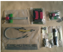
- Nachrüstsatz Trondheim